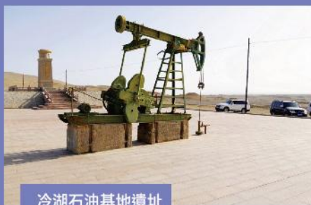
冷湖石油基地遺址