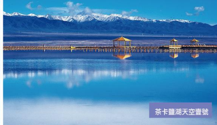
茶卡鹽湖天空壹號