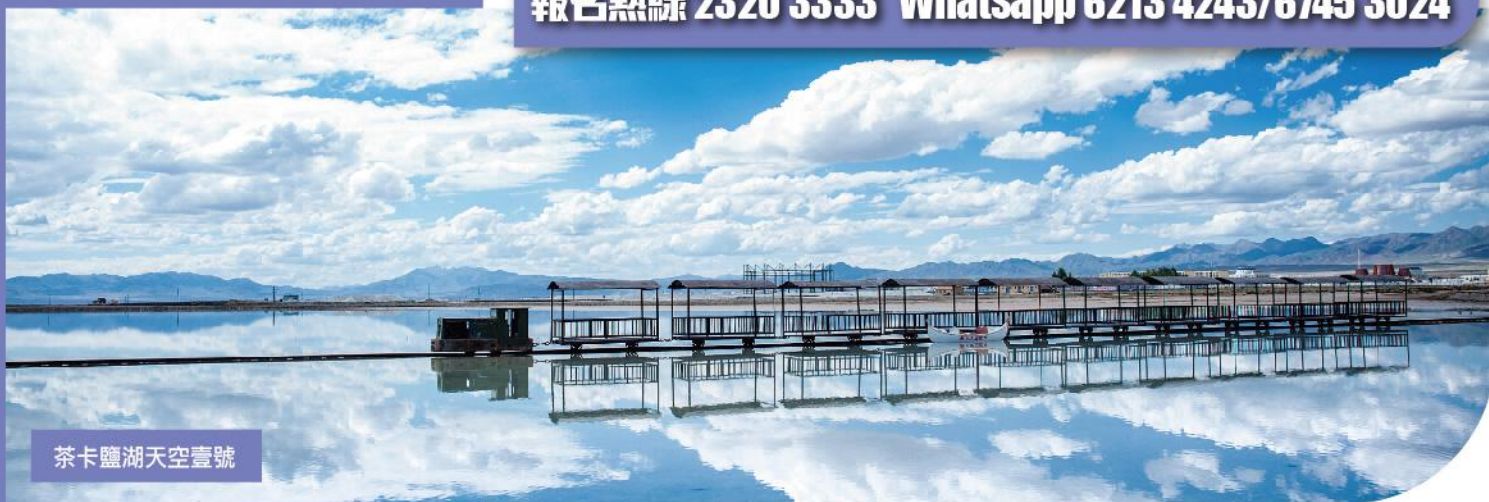
茶卡鹽湖天空壹號