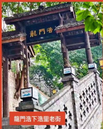
龍門浩下浩里老街