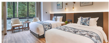
湖濱溫泉山景客房