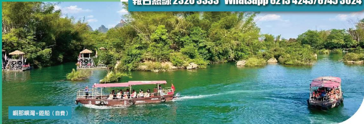
峒那嶼灣+遊船 (自費)