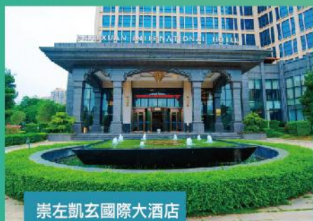
崇左凱玄國際大酒店