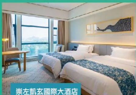
崇左凱玄國際大酒店