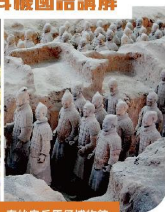
秦始皇兵馬俑博物館