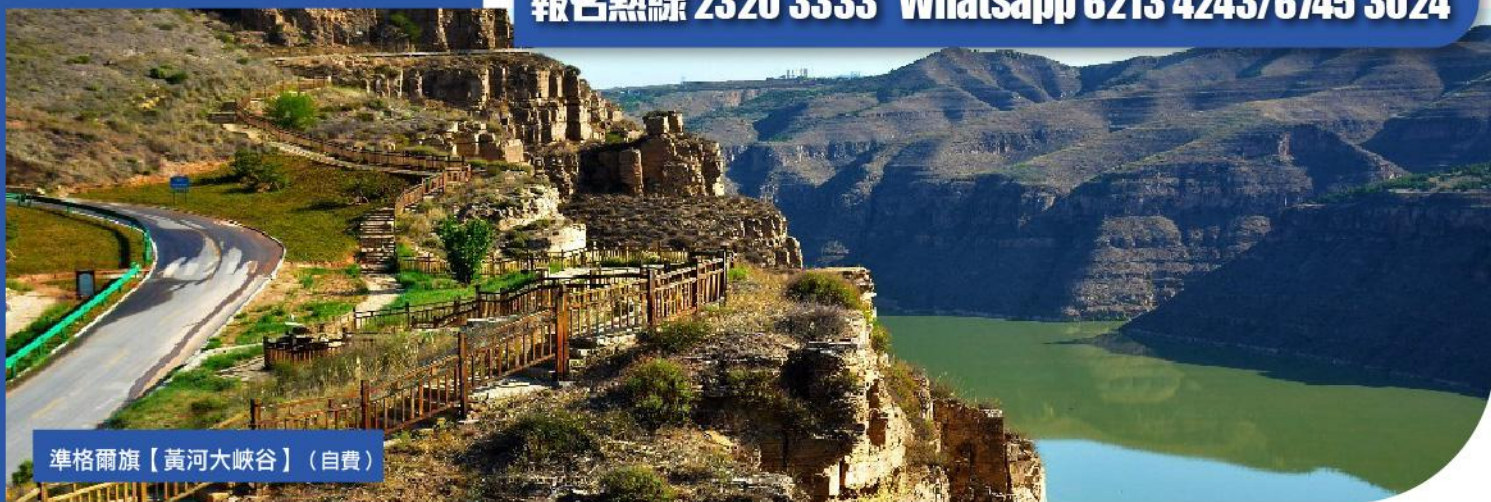
準格爾旗【黃河大峽谷】(自費)