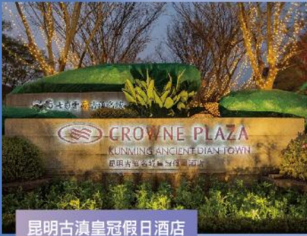
昆明古滇皇冠假日酒店