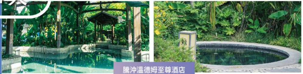
騰冲溫德姆至尊酒店