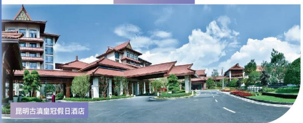
昆明古滇皇冠假日酒店