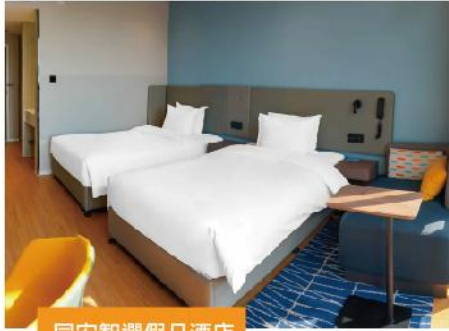
同安智選假日酒店