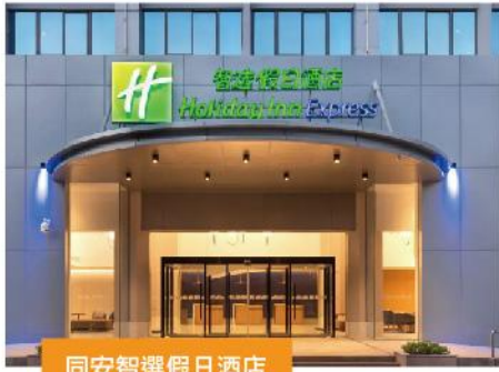
同安智選假日酒店