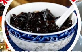
金浪特色手工龜苓膏