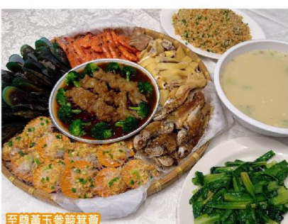
至尊黃玉參鮑箕薈