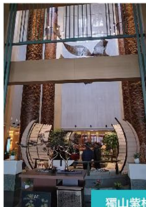
獨山紫林山豪利維拉酒店