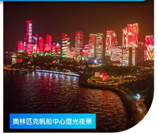
奧林匹克帆船中心燈光夜景