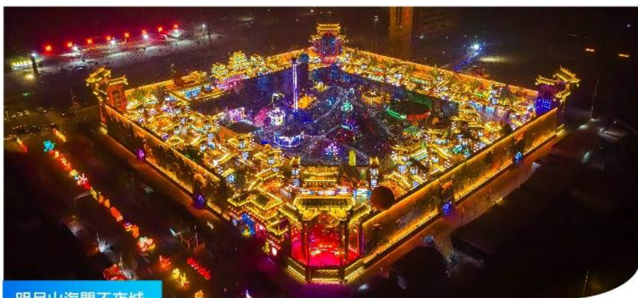
明月山海間不夜城