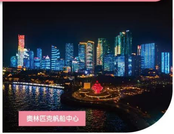
奧林匹克帆船中心