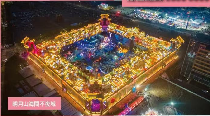
明月山海間不夜城