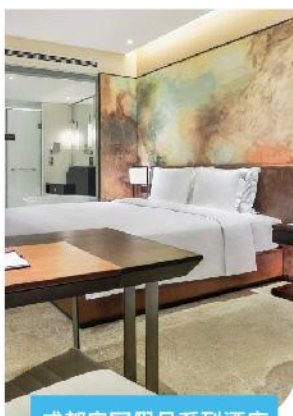
成都皇冠假日系列酒店