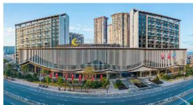
汀州皇冠國際酒店