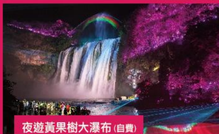
夜遊黃果樹大瀑布 (自費)