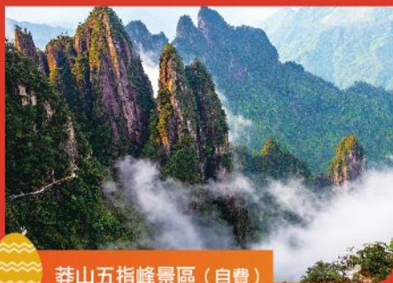
莽山五指峰景區 (自費)