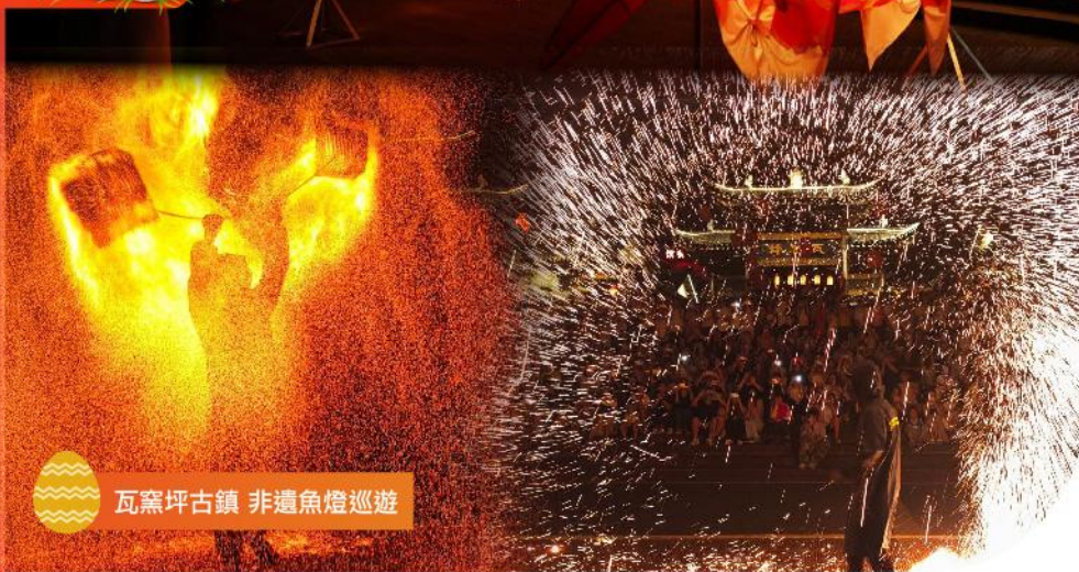
瓦窯坪古鎮 非遺魚燈巡遊