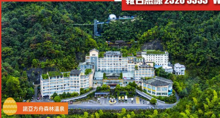
諾亞方舟森林溫泉