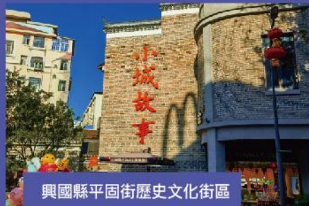
興國縣平固街歷史文化街區