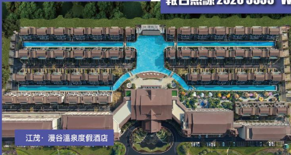
江茂·漫谷溫泉度假酒店