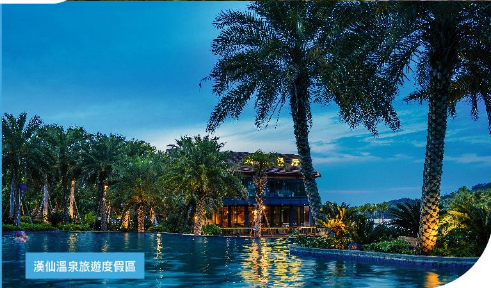
漢仙溫泉旅遊度假區