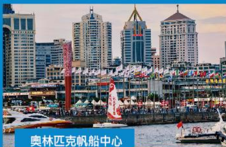
奧林匹克帆船中心