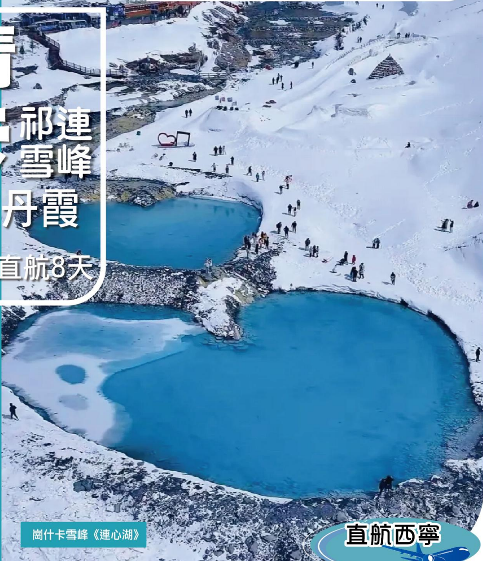
崗什卡雪峰《連心湖》