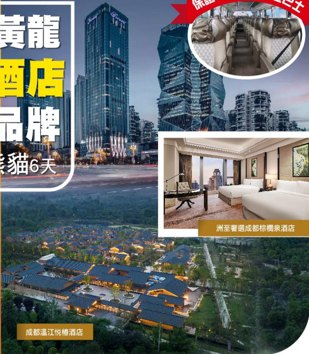
成都溫江悅椿酒店

【九寨5鑽豪華酒店】 九寨莊園國際大酒店/ 九寨溝麗呈花園酒店 KL-SCBF06S