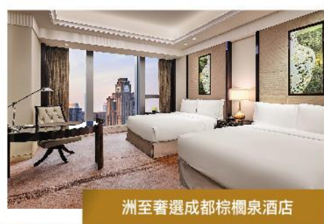
洲至奢選成都棕櫚泉酒店