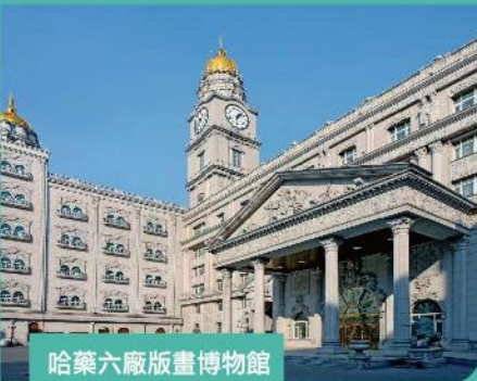
哈藥六廠版畫博物館