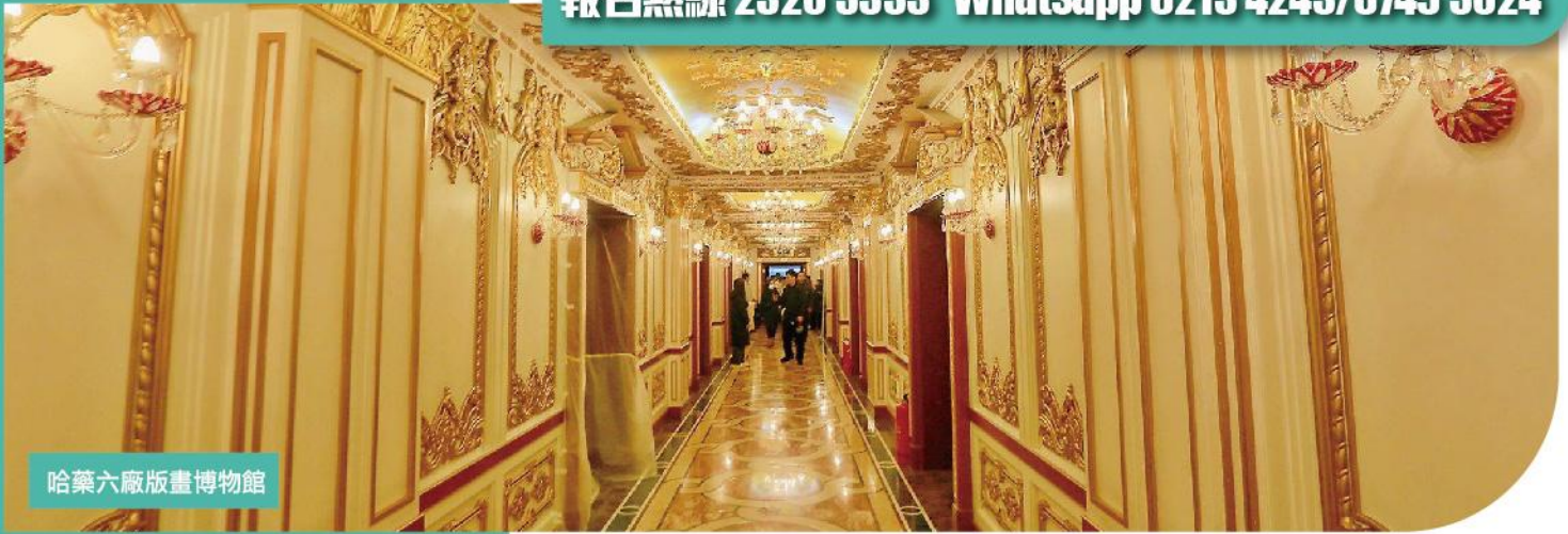
哈藥六廠版畫博物館