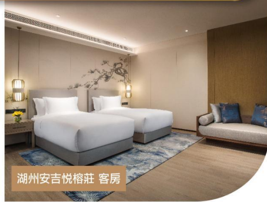
湖州安吉悅榕莊 客房