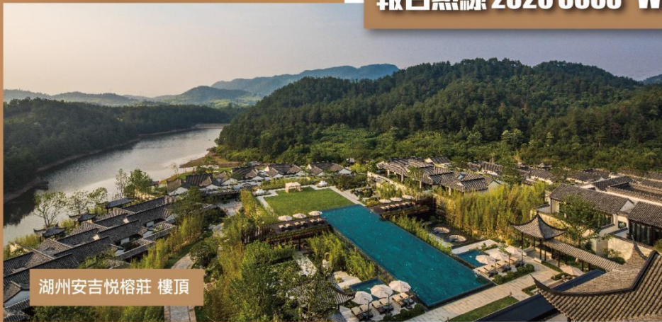
湖州安吉悅榕莊 樓頂