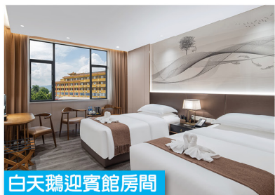
白天鵝迎賓館房間

出發日期: (大假期除外) 2026年3月1日至12月31日 集合時間: (逾時不候) 08:00 羅湖口岸 / 09:00 深圳灣口岸