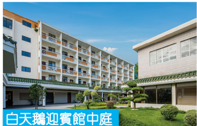
白天鵝迎賓館中庭