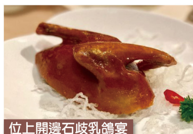
位上開邊石歧乳鴿宴