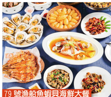
79號漁船魚蝦貝海鮮大餐