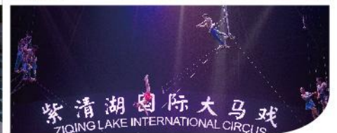
紫清湖國際大馬戲 ZIQING LAKE INTERNATIONAL CIRCUS