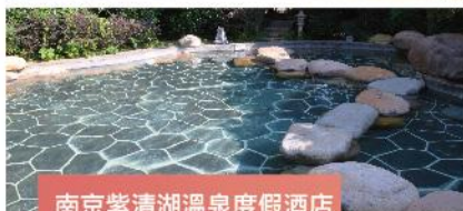
南京紫清湖溫泉度假酒店