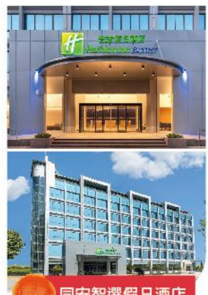
同安智選假日酒店