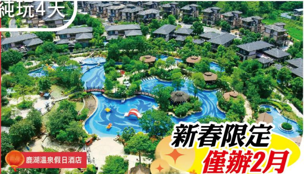
鹿湖溫泉假日酒店