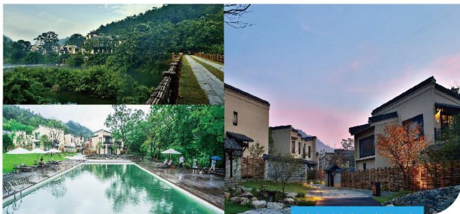
靖安溪真鄉墅度假酒店