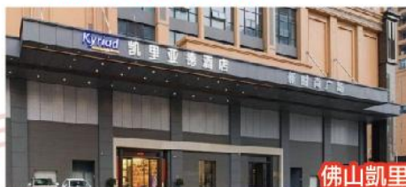
佛山凱里亞德酒店