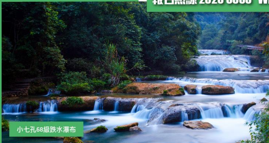
小七孔68級跌水瀑布