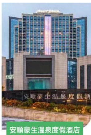
安順豪生溫泉度假酒店