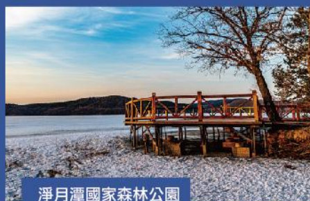
淨月潭國家森林公園