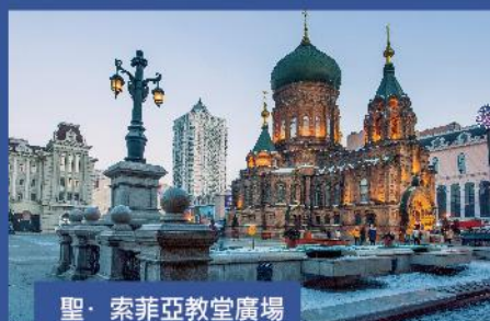
聖· 索菲亞教堂廣場