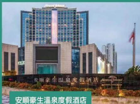
安順豪生溫泉度假酒店