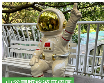
山谷國際旅遊度假區

2 酒店早餐 → 酒店自由活動約 11:30 離開 → 午餐 → 網紅打卡 8 號倉流溪河奧萊小鎮 → 乘坐國內旅遊巴士 🚌 → 深圳 → 送返指定關口解散