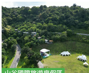
山谷國際旅遊度假區