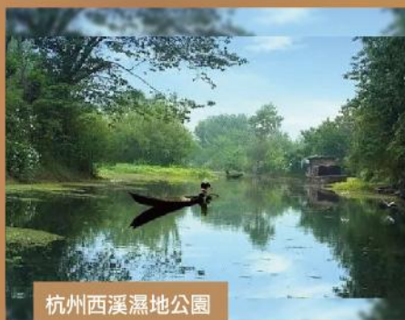
杭州西溪濕地公園