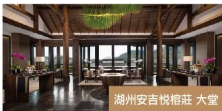
湖州安吉悅榕莊 大堂

品嚐 11月-1月10日 任食大閘蟹 (約60分鐘) (1月11日起 歡樂牧場海鮮烤肉自助餐+酒水暢飲)