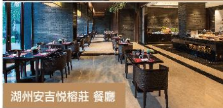
湖州安吉悅榕莊 餐廳