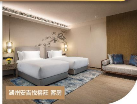
湖州安吉悅榕莊 客房