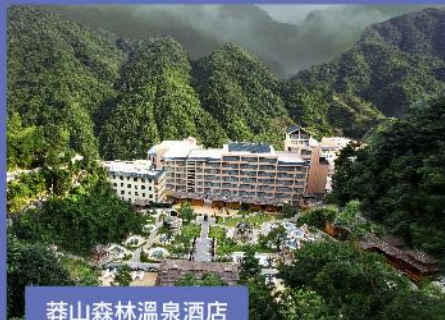
莽山森林溫泉酒店