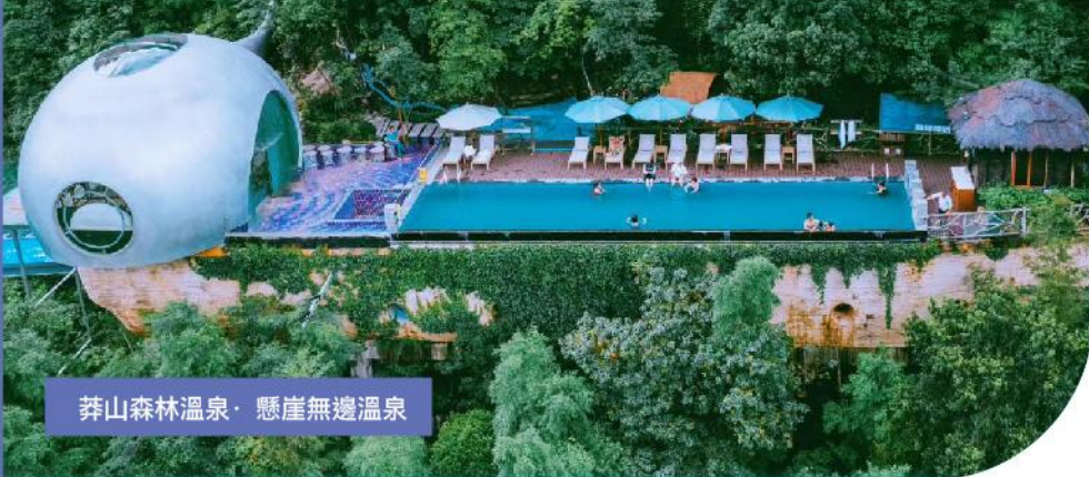
莽山森林溫泉·懸崖無邊溫泉