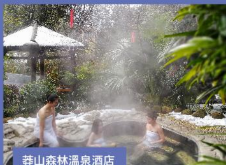
莽山森林溫泉酒店