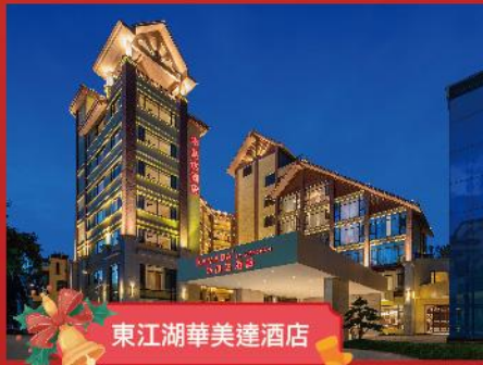
東江湖華美達酒店