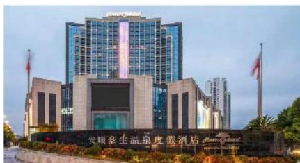
安順豪生溫泉度假酒店