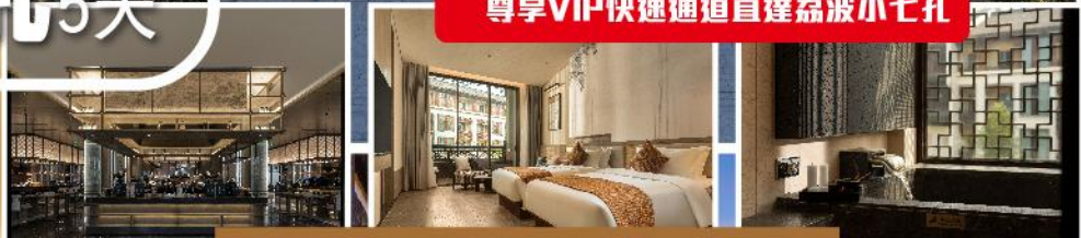
2024年開業 荔波小七孔施柏閣大觀酒店