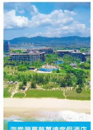
海棠灣嘉華萬達度假酒店