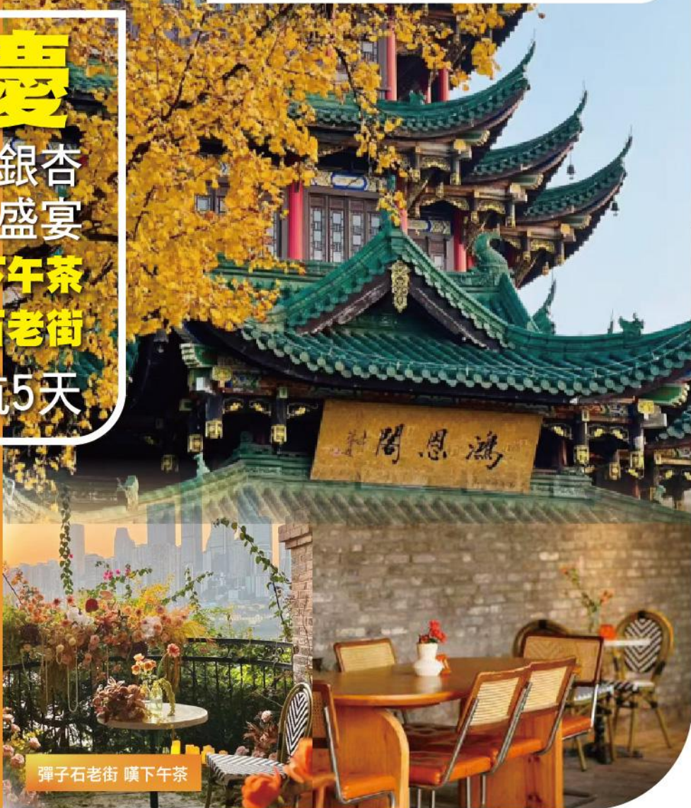
彈子石老街 嘆下午茶