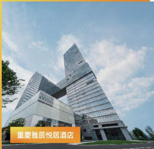
重慶雅辰悅居酒店