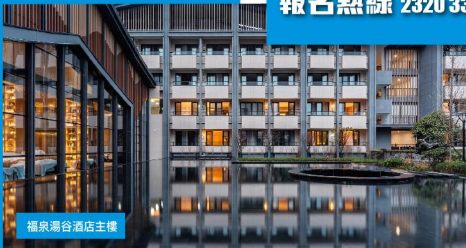
福泉湯谷酒店主樓