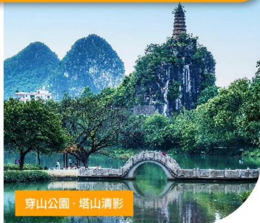
穿山公園·塔山清影