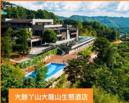
大餘丫山大龍山生態酒店