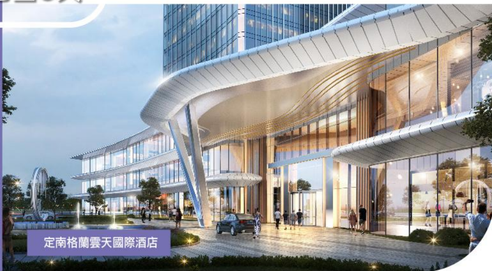
定南格蘭雲天國際酒店