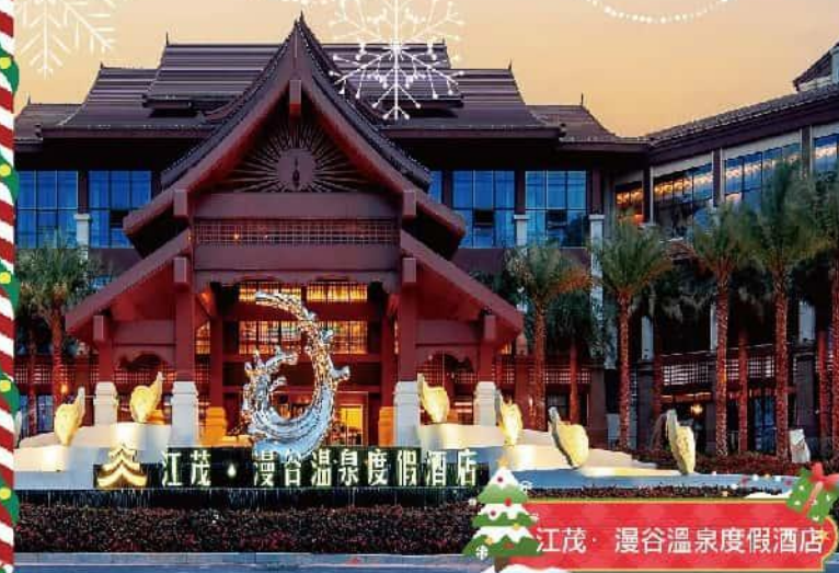
江茂·漫谷溫泉度假酒店