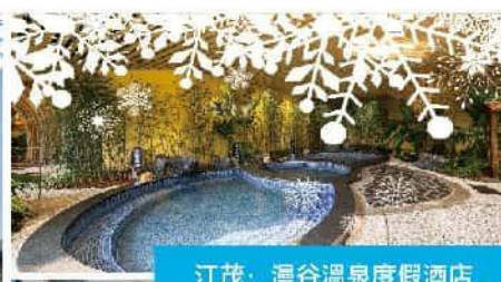
江茂·漫谷溫泉度假酒店