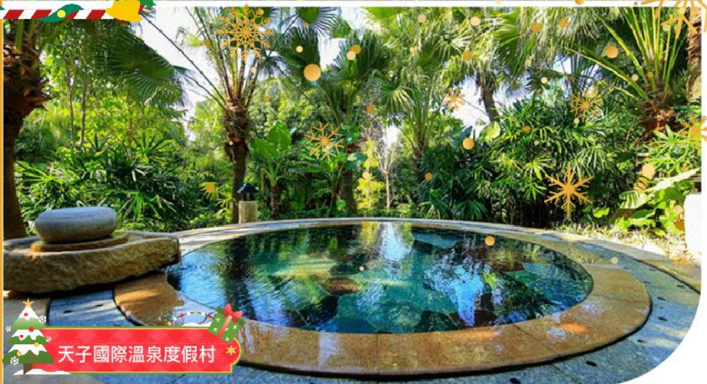
天子國際溫泉度假村