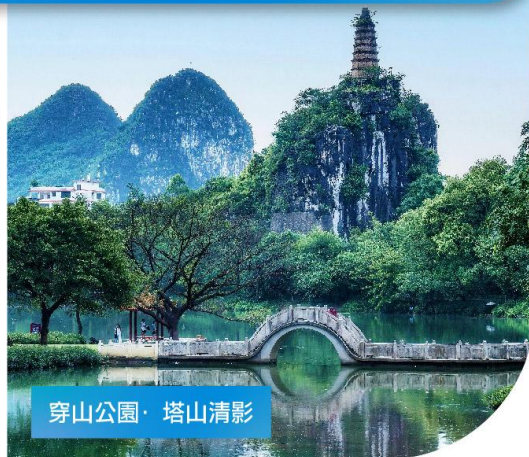
穿山公園·塔山清影