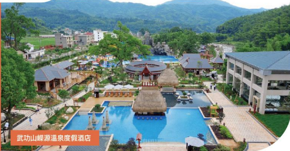
武功山嶸源溫泉度假酒店