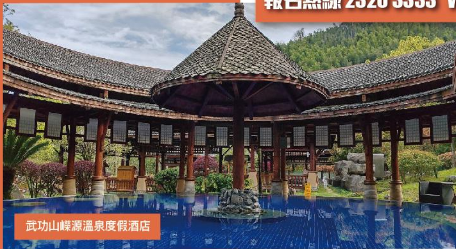
武功山嶸源溫泉度假酒店