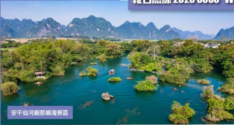
安平仙峒那嶼灣景區