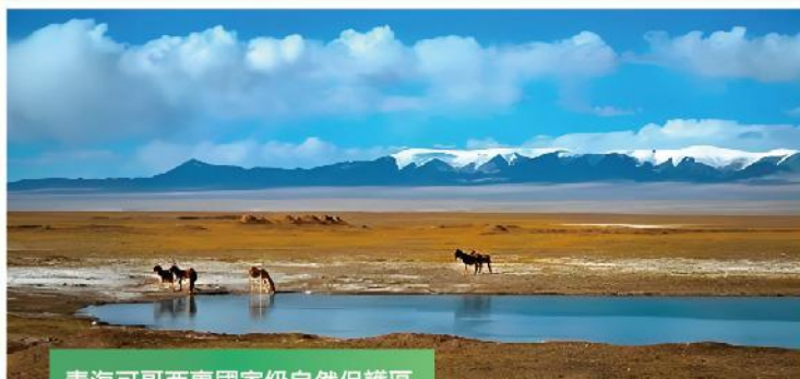
青海可哥西裏國家級自然保護區