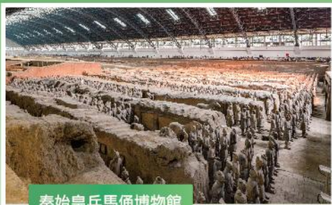
秦始皇兵馬俑博物館